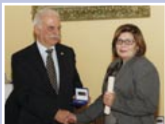
Μετά θάνατον στον Σωκράτη Κάββουρα