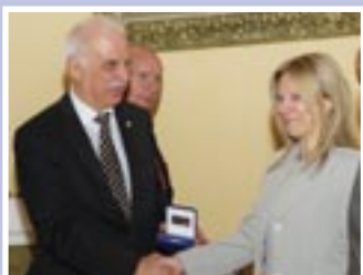
Μετά θάνατον στον Ιωάννη Παπακωνσταντίνου