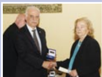
Μετά θάνατον στον Γεώργιο Μήτσαίνα