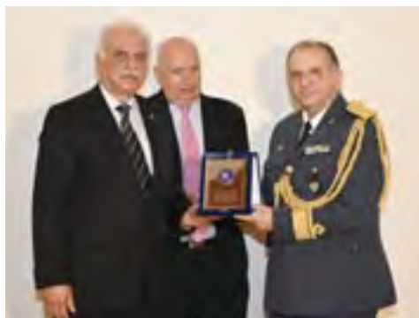
Βράβευση Ιατρικού & Νοσηλευτικού προσωπικού ΠΑ