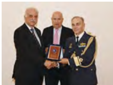
Βράβευση Στελεχών ΠΑ, Ιπταμένων & Εδάφους