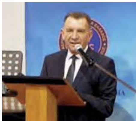
Ο Πρόεδρος και ο Γεν. Γραμματέας της ΑΑΚΕ