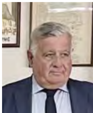
Γεννήθηκε και μεγάλωσε στην Αθήνα. Μετά την περάτωση των γυμνασιακών του σπουδών εισήλθε το 1978 στη Σχολή Ναυτικών Δοκίμων όπου και αποφοίτησε το 1982 με το βαθμό του Σημαιοφόρου. Έχει υπηρετήσει ως Κατώτερος και Ανώτερος Αξιωματικός σε διάφορες μονάδες του Στόλου (πυραυλάκατοι, φρεγάτες, αντιτορπιλικά) και διακλαδικά επιτελεία καθώς και σε ΓΕΝ, ΓΕΕΘΑ, ΥΠΕΘΑ ως σύμβουλος του Υπουργού Αμύνης κ. Σ. Σπηλιωτόπουλου σε θέματα Ευρωπαϊκής Αμυ-

ντικής Πολιτικής. Έχει διατελέσει κυβερνήτης στα Α/Γ ΙΚΑΡΙΑ, Α/Γ ΣΥΡΟΣ και Α/Γ ΡΟΔΟΣ και Δκτής στη Μοίρα Πλοίων Αποβάσεως, στο Πολυεθνικό Κέντρο Θαλάσσιων Μεταφορών του ΝΑΤΟ (AMSCC) και τη Ναυτική Αστυνομία. Το 1986 απεφοίτησε ως Χειριστής Ελικοπτέρων από τη Σχολή Αεροπορίας Στρατού. Ως πιλότος ελικοπτέρων ΠΝ συμμετείχε το 1991-92 στις επιχειρήσεις Desert Storm και Desert Shield στον πόλεμο κατά του Ιράκ. Το 1993 συμμετείχε ως εθελοντής στις ειρηνευτικές επιχειρήσεις σε Βοσνία-Σεράγεβο και το 1994 ήταν παρατηρητής της ΕΕ στα Σκόπια. Έχει υπηρετήσει στη Γαλλία επί 3 έτη ως Αξκός Επιχειρήσεων στην Ευρωπαϊκή Δύναμη Ταχείας Αντιδράσεως και ως επιτελής αναδιοργάνωσης της Γαλλικής Δύναμης Ταχείας Αντιδράσεως FRMARFOR μετά την επανένταξη της Γαλλίας στο στρατιωτικό σκέλος του ΝΑΤΟ το 2005. Για τις υπηρεσίες που προσέφερε στο γαλλικό κράτος παρασημοφορήθηκε το 2007 από την Υπουργό Άμυνας της Γαλλίας Michèle Alliot-Marie με το αργυρό μετάλλιο Τιμής της Λεγεώνας των Ξένων.