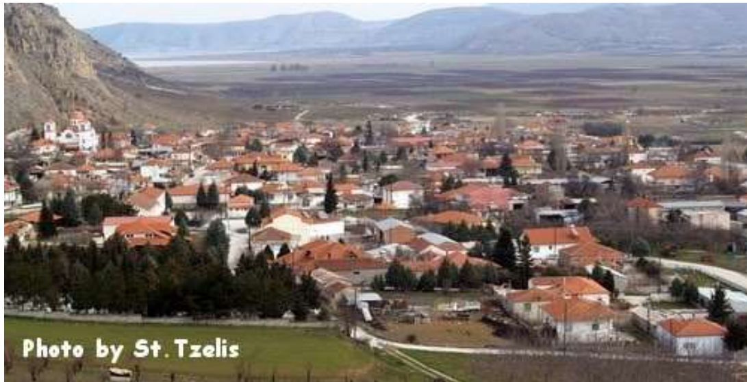
Η Βεγόρα σήμερα

Έτσι 911 άτομα κάτοικοι του χωριού εκτοπίστηκαν από το Τσιφλίκ στην Παϊπούρτη και από εκεί, μέσω Ντιαμπακίρ, Χαλεπίου και Βηρυτού έφθασαν στην Ελλάδα μόλις τα 250 άτομα, με απώλειες του 75 % των κατοίκων και εγκαταστάθηκαν, στο χωριό Κλείτος Κοζάνης και στο χωριό μας, στη Βεγόρα Φλωρίνης με την μακρόχρονη ιστορία του, χιλιετιών, ταυτόσημο πλέον με την Χάλκινη Ασπίδα των Μακεδόνων Μαχητών, που βρέθηκε στο χωριό μου και προέρχεται πιθανότατα από τη μάχη του 274 π.Χ., που έγινε στην περιοχή μεταξύ του βασιλέως των Μολοσσών Πύρρου και του Μακεδονικού στρατού του Βασιλέως Αντιγόνου.