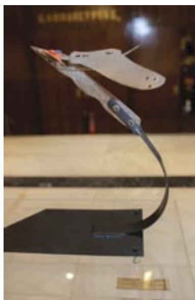
Το επετειακό γλυπτό

Γ. Παρουσίαση του επετειακού γλυπτού με τίτλο « Υπερηχητικό Άγονων Εδαφών » του Κοσμήτορα της Σχολής Καλών Τεχνών Πανεπιστημίου Δυτικής Αττικής, Καθηγητή κ. Χάρη Πρέσσα , αλλά και παρουσίαση μουσικής σύνθεσης του καθηγητή, με τη συν-