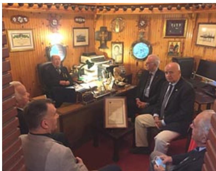
(23-10-2020) Επίσκεψη μελών Δ.Σ. της Α.ΑΚ.Ε. και επίδοση επιστολής θέσπισης βραβείου «ΙΑΚΩΒΟΥ ΤΣΟΥΝΗ»