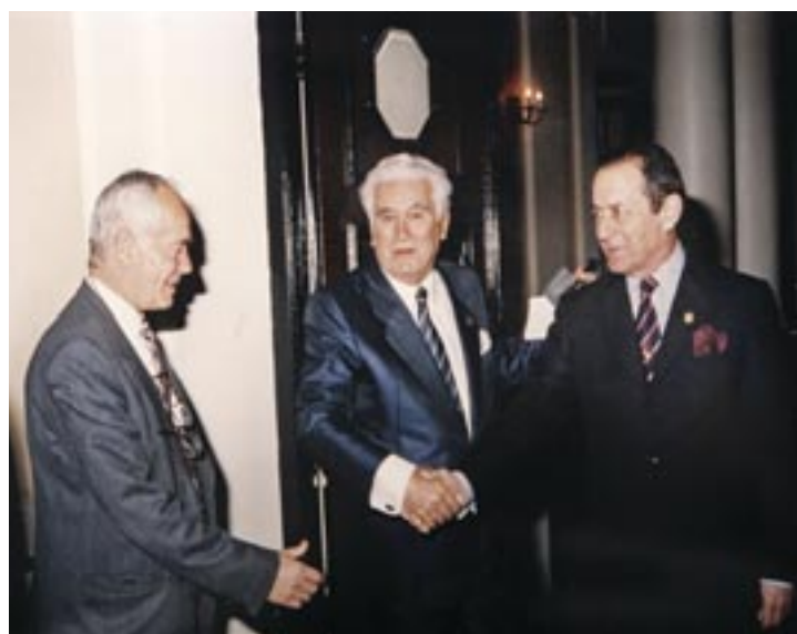
(8-11-1995, ΛΑΕΔ) Ετήσια δεξίωση της Α.ΑΚ.Ε. προς τιμήν των Ε.Δ.