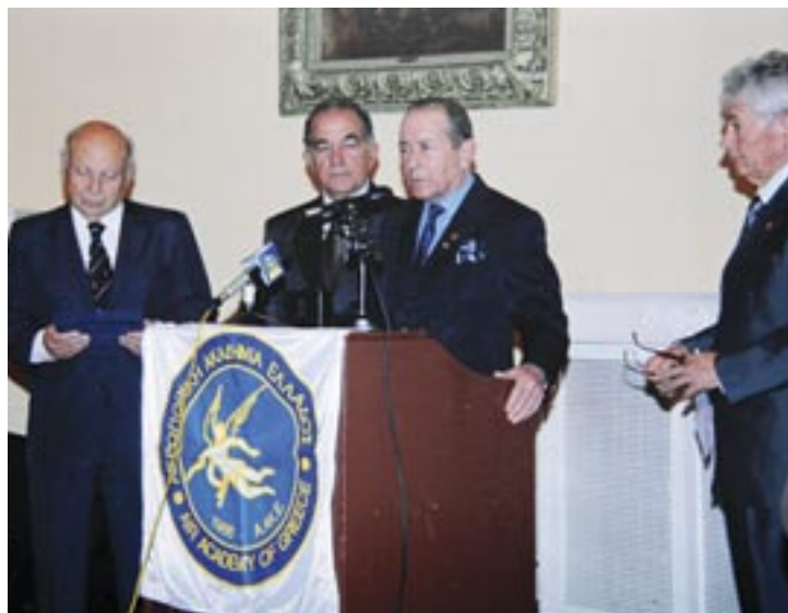
(7-11-2006) Εκδήλωση τιμής προς την Π.Α. στη Λ.Α.Ε.Δ. από την Α.ΑΚ.Ε.