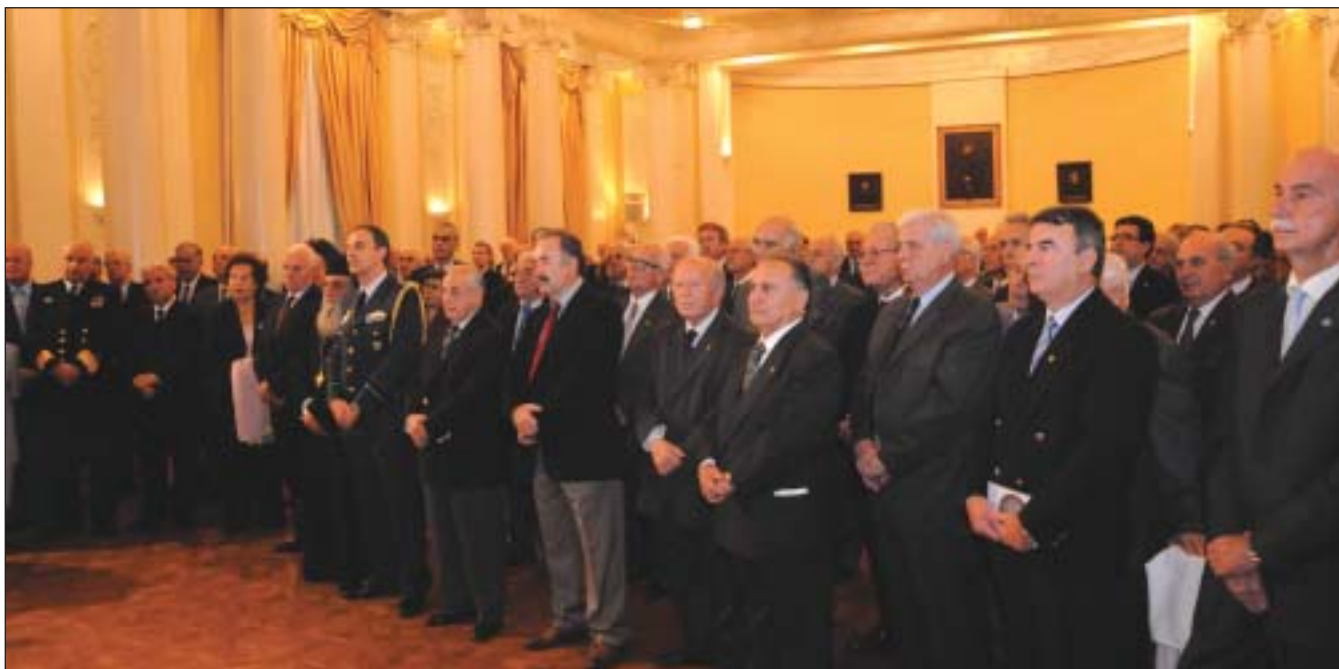
Στιγμιότυπο από την εκδήλωση μνήμης και τιμής προς την Π.Α. την 6η Νοεμβρίου 2009 στη ΛΑΕΔ

Τα γραφεία της Α.Α.Κ.Ε. θα παραμείνουν κλειστά από 21.12.09 έως και 07.01.10