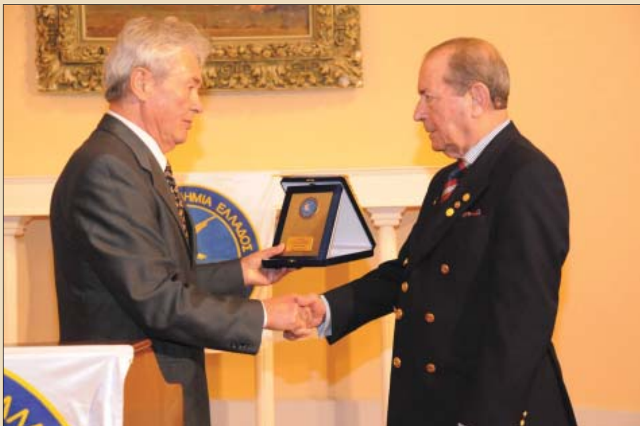
Στιγμιότυπο από τη βράβειυσή