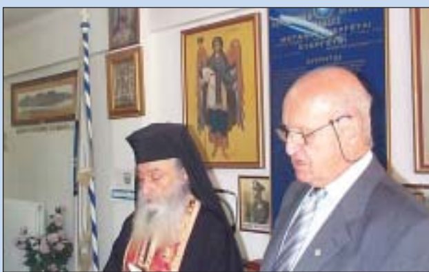
Στιγμιότυπο από τον Αγιασμό