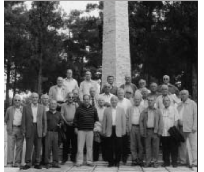
Η 6η Σειρά ΣΥΔ στο Ηρώο της Σχολής (26/9/09)

Το τρίημερο 25 έως 27 Σεπτεμβρίου 2009 πραγματοποιήθηκε μεγαλειώδης επετειακή συνάντηση αποφοίτων της 6ης ηρωικής Σειράς ΣΥΔ για τα πενήντα χρόνια.