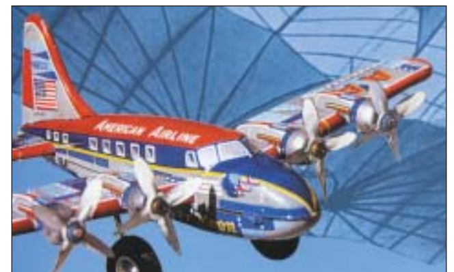
Ένα από τα 1.200 εκθέματα-μινιατούρες

Αυτά τα έργα τέχνης μας διδάσκουν ιστορία και η Α.ΑΚ.Ε. θέλει να συγχαρεί τους σπουδαίους συντελεστές που είχαν την πρωτότυπη αυτή ιδέα, η οποία ως πολλαπλασιαστής ιστορικής μνήμης ενισχύει την εθνική μας αυτοπεποίθηση και στον τομέα αυτό που στις μέρες μας είναι απολύτως αναγκαία.