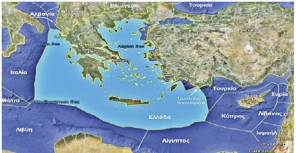
Η Ελληνική ΑΟΖ και ο Χάρτης της Σεβίλης 2007

...συστήσι "Συμβούλιο Εθνικής Ασφάλειας" για το συντονισμό των πολιτικών της Στρατηγικής Εθνικής Ασφάλειας* μεταξύ των κυβερνητικών υπηρεσιών και την παροχή κατευθύνσεων που άπτονται θεμάτων εξωτερικής πολιτικής και ασφάλειας-άμυνας;