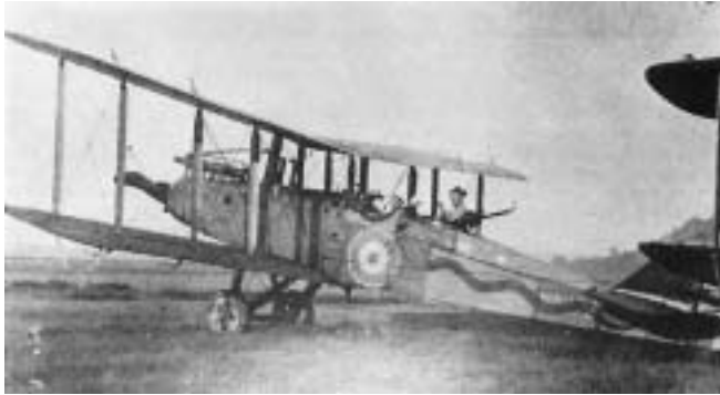
Αεροπλάνο DH9 της Στρατιάς Μικράς Ασίας

το αεροπλάνο; Ο άνθρωπος σκέφθηκε μόνο τον εαυτό του, που θα εξετίθετο. Η διάσωση δύο αεροπόρων και ενός πολυτιμού αεροπλάνου, του ήταν αν μη αδιάφορη, πάντως δευτερεύον ζήτημα.