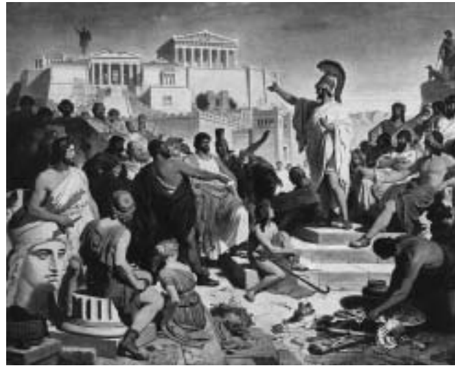
Άρθρο του ΠΑΝΑΓΙΩΤΗ ΓΙΑΝΝΟΠΟΥΛΟΥ Απτχου (I) ε.α. Μέλους Α.Α.Κ.Ε.

Η αξιοσύνη οδηγεί στην προσέγγιση της αλήθειας. Η αξιοσύνη του επιστήμονα, του καλλιτέχνη, του τεχνίτη, του γεω-