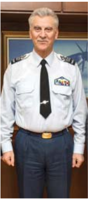
Ο Α/ΓΕΑ Απτχος (Ι) ΧΡΗΣΤΟΣ ΧΡΙΣΤΟΔΟΥΛΟΥ

“ Ο Αντιπέρραρχος (Ι) Χρήστος Χριστοδούλου είναι ο Αρχηγός του Γενικού Επιτελείου Αεροπορίας. Είναι υπεύθυνος για την άρτια οργάνωση, στελέχωση, εξοπλισμό, εκπαίδευση, αξιολόγηση, προπαρασκευή για πόλεμο και ετοιμότητα του συνόλου του στρατιωτικού και πολιτικού προσωπικού της Πολεμικής Αεροπορίας. Είναι μέλος του Συμβουλίου Άμυνας και του Συμβουλίου Αρχηγών Γενικών Επιτελείων και μαζί με τους Αρχηγούς των λοιπών Κλάδων των Ενόπλων Δυνάμεων, στρατιωτικός σύμβουλος του Υπουργού Εθνικής Άμυνας. Ανέλαβε τα καθήκοντά του στις 16 Ιανουαρίου 2017. ”