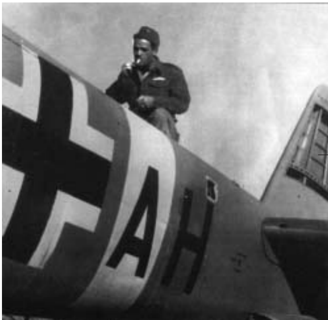
Έλληνας Αξιωματικός της 336 ΜΑ ανάβει το τσιγάρο του σκαφαλωμένος πάνω σε εγκαταλελειμμένο γερμανικό αεροσκάφος. Είναι το τέλος του πολέμου και η γερμανική αεροπορία δεν αποτελεί πλέον το φόβητρο των πρώτων ετών της αναμέτρησης (φωτ.: Αρχείο Δ. Βουτσινά) Αναδημοσίευση από το επετειακό ένθετο της εφημερίδας «Η ΚΑΘΗΜΕΡΙΝΗ» της 14/11/2006

Η ανδρεία των τμημάτων της Ελληνικής Ταξιαρχίας, όπως δήλωσε ο Μοντγκόμερι, προκάλεσε το θαυμασμό στις δυνάμεις της Βρετανικής Αυτοκρατορίας.