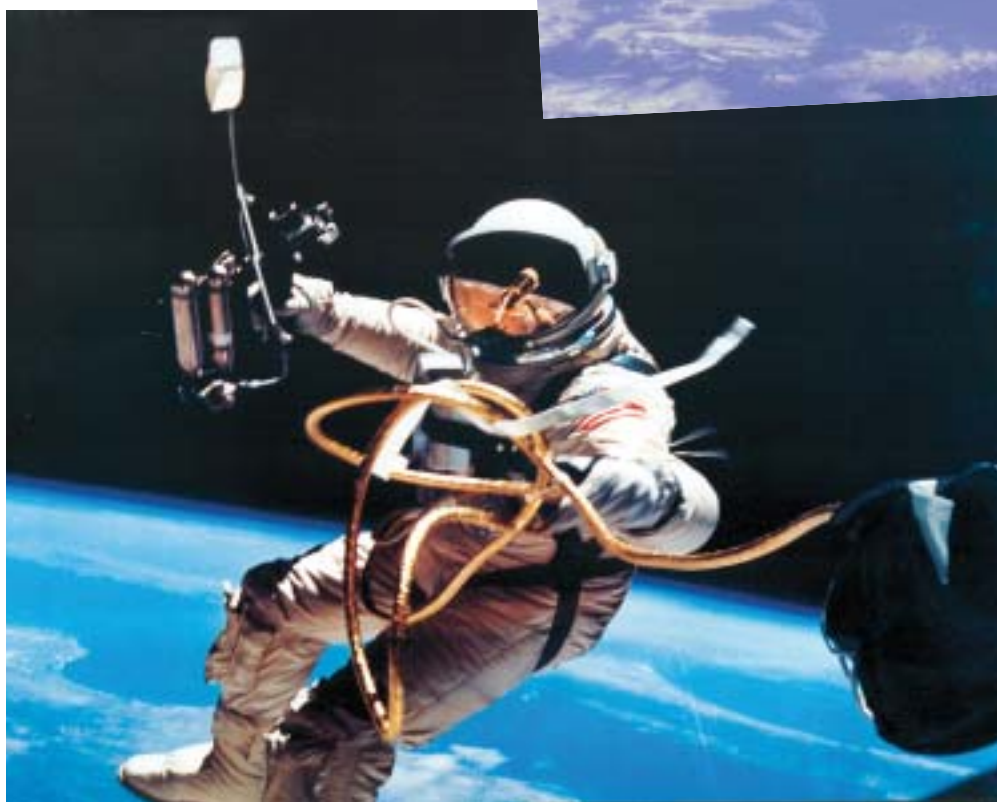
Ο αστροναύτης Ed. White εκτελώντας τον πρώτο περίπατο των Ηνωμ. Πολιτειών στο Διάστημα εκτός του διαστημόπλοιου Gemini IV στις 3 Ιουνίου 1965. Μία σημαντική πρόοδος του προγράμματος αποστολής ανθρώπου στη Σελήνη

Στις 31 Ιανουαρίου 1961, οι Αμερικανοί εκτοξεύουν το διαστημόπλοιο « Μέρκιουρι » προκειμένου να αντλήσουν επιστημονικές πληροφορίες από τη συμπεριφορά ενός χιμπατζή που είναι δεμένος εντός του θαλαμίσκου. Ο χιμπατζής με το όνομα « Χαμ », ήταν