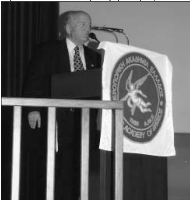
Ο Β' Αντιπρόεδρος ΑΑΚΕ Απχρος ε.α. Ηρακλής Ναούμ στο βήμα

Εκτός από αυτά όμως η Πολεμική Αεροπορία μαθαίνει το νέο να προτάσσει το καλό του συνόλου και όχι το ατομικό συμφέρον, βλέποντας τις ενέργειες και τις αποφάσεις που λαμβάνει αυτή, του διδάσκει τη σημασία της συμβίωσης σε μια οργανωμένη κοινωνία, στην οποία επικρατεί η πειθαρχία και η τάξη και στην οποία ο καθένας καθιερώνεται αποδεικνύοντας καθημερινά την αξία του, δεί-