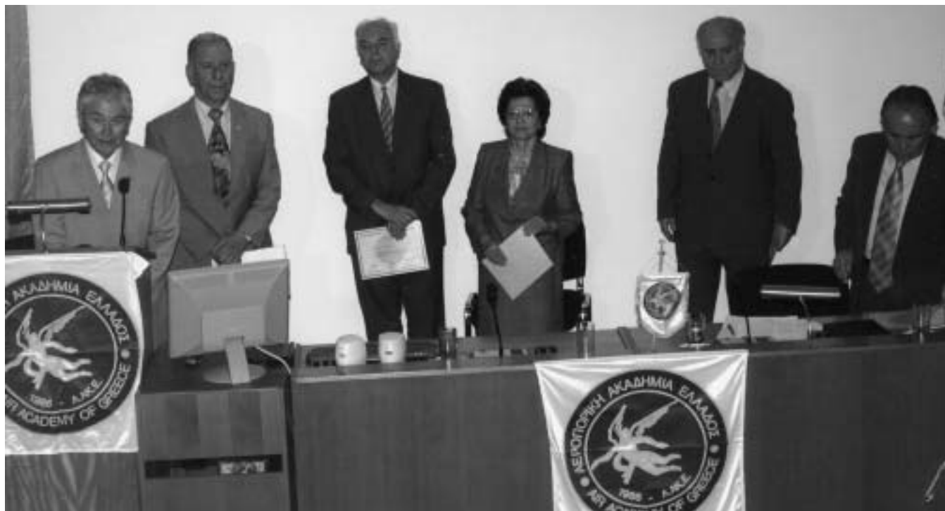
Από τη βράβευση των πρωτεύσαντων στον Πανελλήνιο Διαγωνισμό Ποίησης της ΑΑΚΕ

Η Κριτική Επιτροπή Ελευθέριος Τζόκας, Μαργαρίτα Κασάπογλου, Γεώργιος Σπυρόπουλος