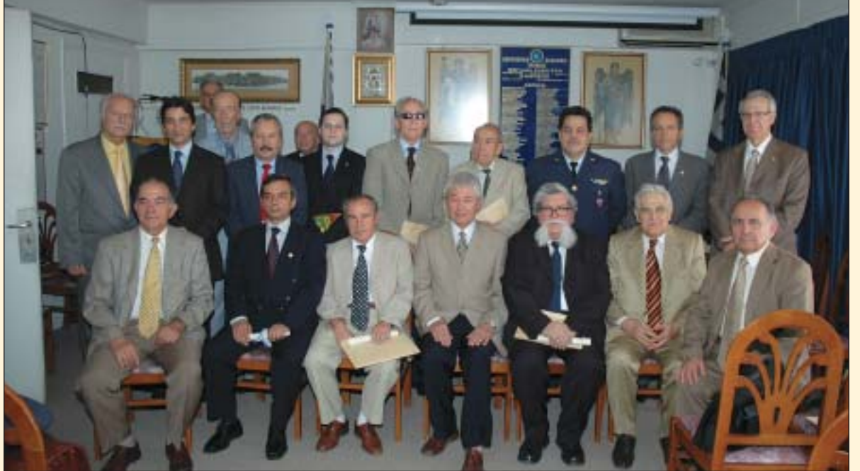
Τα νέα μέλη πλαισιωμένα από το Δ.Σ. της Α.Α.Κ.Ε.

Κατά την αντιφώνηση όλα τα νέα μέλη θερμά ευχαρίστησαν τον πρόεδρο και το Δ.Σ. της Α.Α.Κ.Ε. Έκαναν αναφορά με μεγάλη συγκίνηση στις σχέσεις που έχουν με το Αεροπορικό πνεύμα γενικά και υποσχέθηκαν να βοηθήσουν στην επίτευξη των στόχων της Α.Α.Κ.Ε.