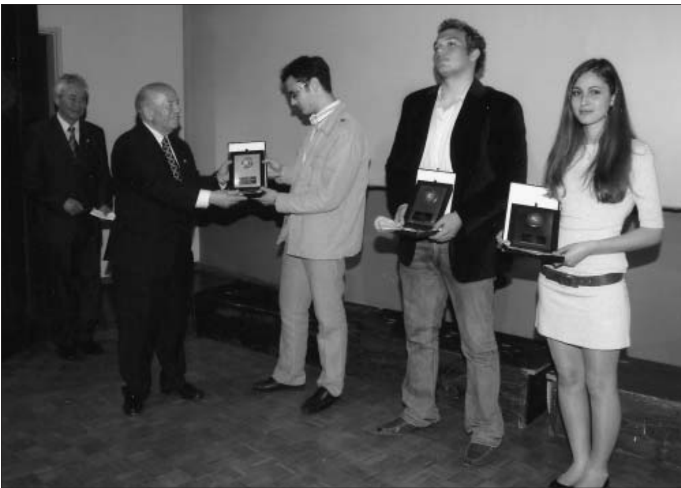
Στιγμιότυπο από τη βράβευση των πρωτευσάντων μαθητών της Γ' Λυκείου

Τι είναι άραγε αυτό που θα κάνει ένα νέο της ηλικίας μας να δει με διαφορετικό μάτι το μοντέλο πειθαρχίας και υπακοής; Κάποιοι στρατευμένοι πιλότοι της Πολεμικής Αεροπορίας; Τι είναι άραγε αυτό που θα μας κάνει να δούμε έναν τέτοιο άνθρωπο ως το δικό μας άνθρωπο; Τίποτα περισσότερο από το να σκεφτούμε πως η ίδια στρατιωτική πειθαρχία που τον κάνει να αναχαιτίζει εχθρούς στον αέρα, του επιτρέπει να είναι σε θέση να σβήνει φωτιές που απειλούν, να σώζει συνανθρώπους που πνίγονται, να βοηθά παιδιά που πεινούν στην άλλη άκρη του πλανήτη. Και όλα αυτά γιατί αυτοί μπορούν να το κάνουν καλύτερα και πιο αποτελεσματικά από εμάς».