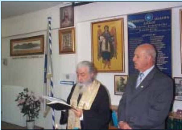
Στιγμιότυπο από τον αγιασμό

Κατά την Ειδική Συνεδρία της 7ης Δεκεμβρίου 2007 που πραγματοποιήθηκε στην κατάμεστη αίθουσα συνεδριάσεων της Α.ΑΚ.Ε. έγινε η καθιερωμένη ετήσια επιμνημόσυνη δέηση στη μνήμη των θανόντων μελών της από την ίδρυση της.