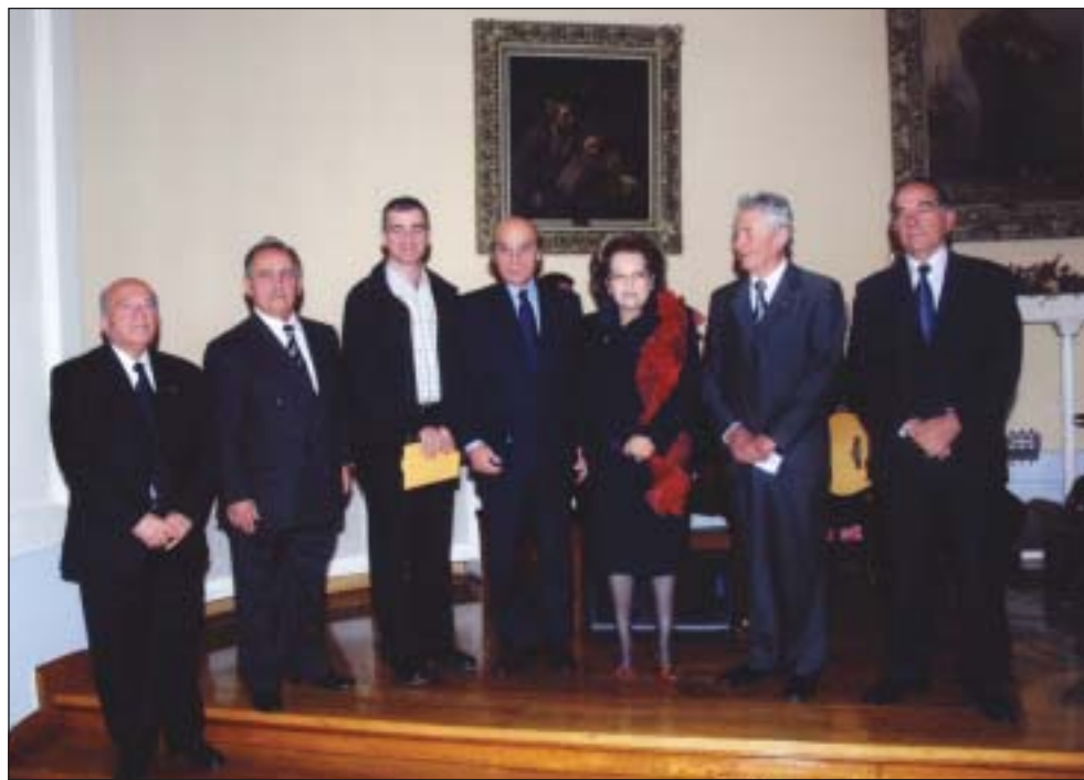
Από την απονομή τμητικών διακρίσεων στους εκπροσώπους των ανθρωπιστικών οργανώσεων στην εκδήλωση που πραγματοποιήθηκε στη ΛΑΕΔ 7.11.2007

φτώχεια και να φέρουμε ειρήνη και ασφάλεια στον κόσμο.