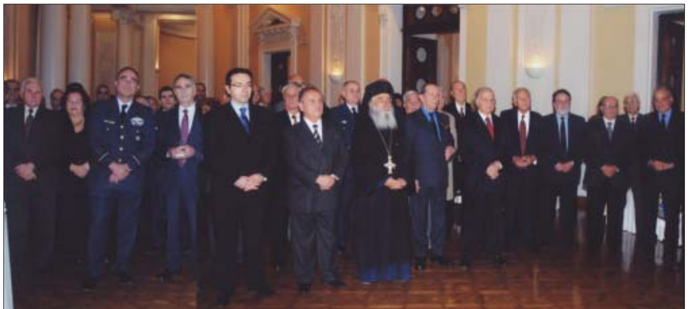
Στιγμιότυπο από την εκδήλωση τιμής προς την Π.Α. της 7ης Νοεμβρίου στη ΛΑΕΔ

Τα γραφεία της Α.ΑΚ.Ε. θα παραμείνουν κλειστά από 24.12.07 έως και 04.01.08