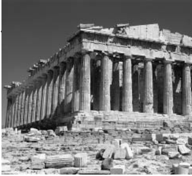
ΖΑΧΑΡΙΑΣ Ι. ΠΛΑΪΤΑΚΗΣ Τακτικό μέλος της Α.Α.Κ.Ε.

Μια σύνθεση αντιθέσεων, δύο διαφορετικών ιδεολογικών πολιτευμάτων που συνδυάζει της αρχές, τις αξίες και