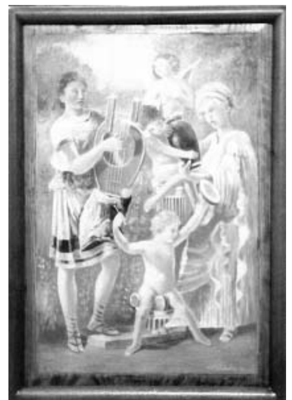
Σταύρου Καλυβιώτη: «Ορφέας και Ευρυδίκη» (Ελαιογραφία σε παλαιό ξύλο)