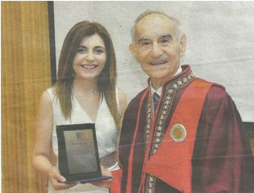
Ο διακεκριμένος καθηγητής Βασίλειος Χ. Γολεμάτος ενώ λαμβάνει από την αναπληρώτρια καθηγήτρια Μαρία Λαμπροπούλου την τιμητική πλακέτα για την ανάδειξή του σε Επίτιμο Διδάκτορα Ιατρικής του ΔΠΘ

Η Α.ΑΚ.Ε. συγχαίρει τον σπουδαίο καθηγητή - χειρουργό και εκλεκτό μέλος της κ. Βασίλειο Γολεμάτη, για τη διάκρισή του αυτή και του εύχεται κάθε επιτυχία στα ακαδημαϊκά - ιατρικά του καθήκοντα και άλλες διακρίσεις.