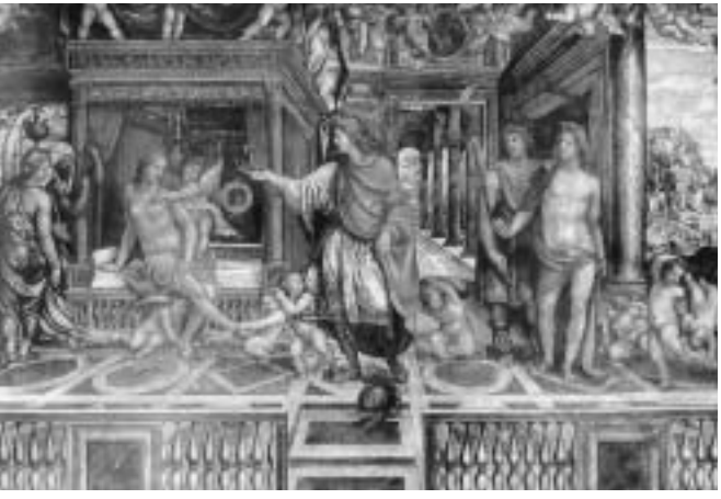
Γάμος Μεγάλου Αλεξάνδρου και Ρωξάνης (πηνιά, ιστότοπος Iran Chamber Society)

Μητέρα του Μεγάλου Αλεξάνδρου, μέχρι τη δολοφονία τους, πρώτα της Ολυμπιάδας και μετά της συζύγου και του διαδόχου του, σβήνοντας τη γραμμή αίματος του σημαντικότερου στρατηλάτη της ιστορίας, το 311 π.Χ. Υπάρχουν και άλλες εκδοχές και μύθοι σχετικά με τη ζωή τους, η οποία απασχόλησε την παγκόσμια λογοτεχνία και την τέχνη γενικότερα. Αυτό όμως που δεν είναι ευρέως γνωστό είναι ότι ο Ιπποκράτης ο Δ', γιος του Δράκοντα και εγγονός του Ιπποκράτη, ήταν γιατρός της Ρωξάνης, την ακολούθησε και στη φυλακή μαζί με το γιο της ως μέλος της βασιλικής αυλής της Μακεδονίας και είχαν την ίδια τύχη. Οι δυο γιοί του Ιπποκράτη, ο Θεσσαλός και ο Δράκων, μετά το θάνατο του πατέρα τους πήγαν στη Μακεδονία, ο μεν Θεσσαλός στην Πέλλα ως γιατρός στην αυλή του βασιλιά της Μακεδονίας Αρχελάου, ο δε Ιπποκράτης ο Δ', γιος του Δράκοντα, ως γιατρός της Ρωξάνης. Άλλωστε ήταν παράδοση των Μακεδόνων Βασιλέων να εμπιστεύονται γιατρούς από την ιατρική σχολή της Κω για πολλά χρόνια.