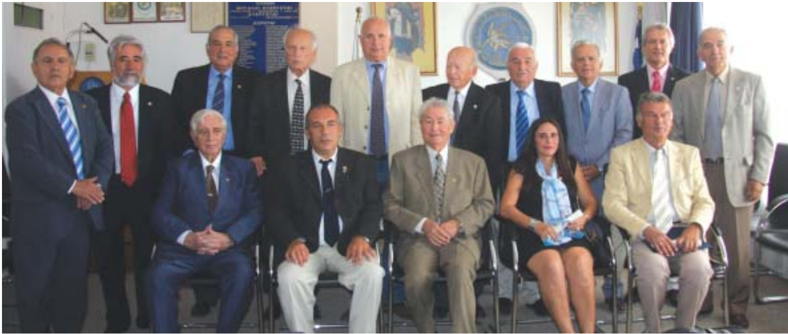
(αριστερά) Τα νέα Τακτικά Μέλη στην καθιερωμένη αναμνηστική φωτογραφία μετά την Ορκωμοσία τους μαζί με τα μέλη του Δ.Σ. της Α.ΑΚ.Ε.