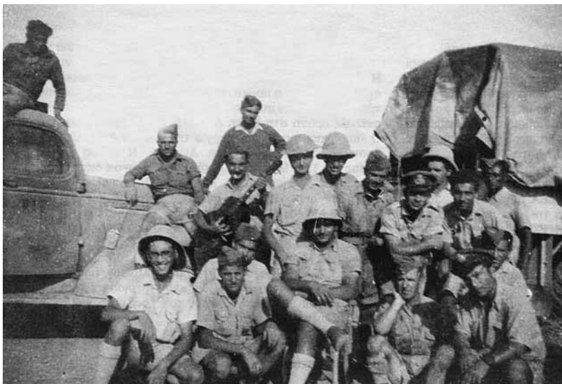
1941-42: Έλληνες αεροπόροι σε διάλειμμα της εκπαίδευσής τους στη Μέση Ανατολή