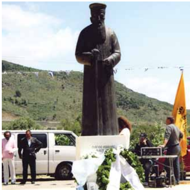
Από τα αποκαλυπτήρια του αγάλματος του Αγίου Κοσμά του Αιτωλού στη Μακύνεια Αιτωλοακαρνανίας

Η Ακαδημία συγχαίρει και εκφράζει τα συγχαρητήριά της στα δύο δραστήρια μέλη της.