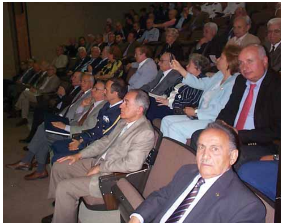
Άποψη από το κατάμεστο Αμφιθέατρο του 251 ΓΝΑ στην Ημερίδα της Α.ΑΚ.Ε. 23.5.2012

Αναμνηστικά, προς τιμήν στους διακεκριμένους ομιλη-