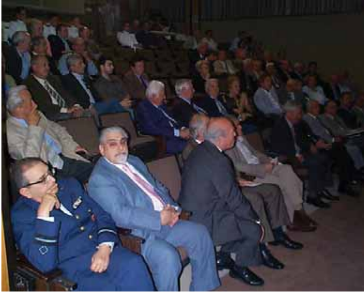
Αποψη από την ημερίδα για τα Εθνικά Θέματα (23.5.2012)

Οι Βαλκανικοί πόλεμοι 1912-1913 είναι οι πιο ευτυχισμέ-