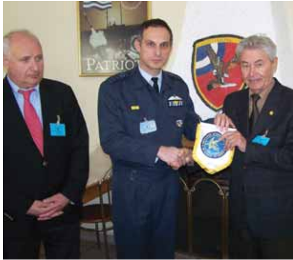
Ο Δκτής της Μοίρας και ο Πρόεδρος της Α.ΑΚ.Ε. κατά την ανταλλαγή αναμνηστικών