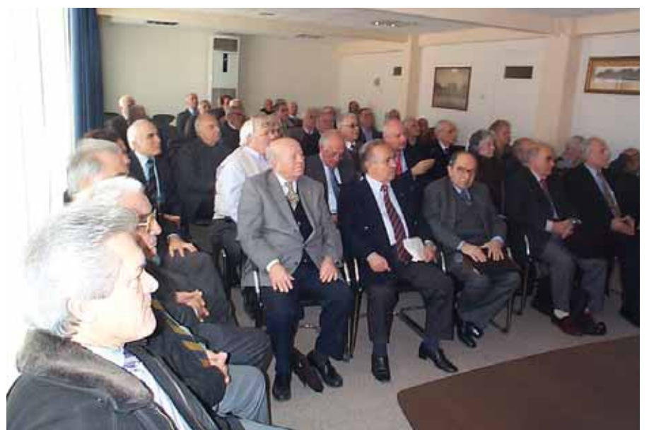
Άποψη από την ΚΣΤ' Ετήσια Γενική Συνέλευση της ΑΑΚΕ

✓ ΓΝΩΣΤΟΠΟΙΗΣΗ: Τα γραφεία της Α.Α.Κ.Ε. θα παραμείνουν κλειστά λόγω των εορτών του Πάσχα από Μ. Δευτέρα 9.4.2012 έως και Κυριακή 22.4.2012.