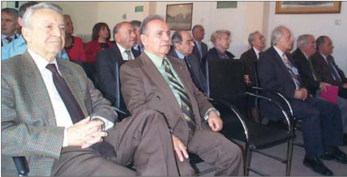
Συνέχεια από τη σελ. 1