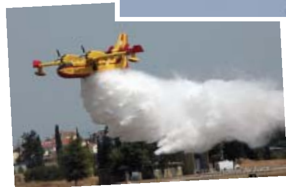
ΑΠΟ ΤΗΝ ΙΣΤΟΣΕΛΙΔΑ ΤΟΥ ΓΕΑ: www.haf.gr