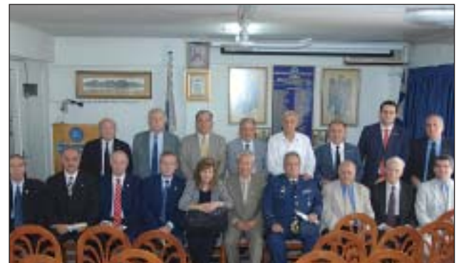
Τα νέα μέλη μετά του Δ.Σ. της Α.ΑΚ.Ε.

«Η σημερινή μέρα είναι μια τιμητική και συγκινητική στην καριέρα μου και στη ζωή μου γενικότερα. Καθίσταμαι συμμετοχος σ' ένα ιστορικό θεσμό, με στόχο τη διαφύλαξη και διαίωνιση του αεροπορικού ιδεώδους. Η είσοδός μου στη Σχολή Ικάρων με όνειρα και στόχους προσφοράς, επιλέγοντας δύσκολους δρόμους, βάζοντας το συμφέρον της υπηρεσίας πάνω από προσωπικές επιτυχίες ευδαιμονίας και γαλήνης. Πέρασα δύσκολες στιγμές αλλά και ευχαρίστες. Η σημερινή διάκριση ενισχύει τους δεσμούς μου με την Αεροπορική Ιδέα. Ελπίζω να συνδράμω στο έργο σας».